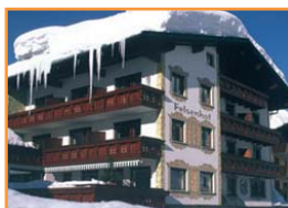
HOTEL FELSENHOF ○○○○

Con sólo 19 habitaciones es uno de los hoteles con mejor relación calidad precio de Lech. A 300 m. del centro y 500 de los remontes (skibus).