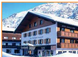
HOTEL GOTTHARD ○○○○

Situado en pleno centro, a solo 150 metros de los remontes. Un muy buen hotel con excelentes instalaciones de Spa y piscina indoor.