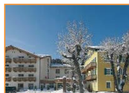
HOTEL ASTORIA ○○○○

Un hotel centenario pero completamente renovado en 2008, ideal para parejas. A 400 metros del centro y frente al Ski-Bus.