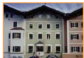
APARTAMENTOS GRIESSER ○○○

Un hotel tradicional, sencillo pero correcto y con una situación llena de encanto en pleno casco viejo, a 400 m. del teleférico.